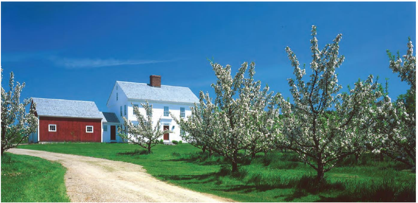
WELLS entsteht 2019 in Bayern