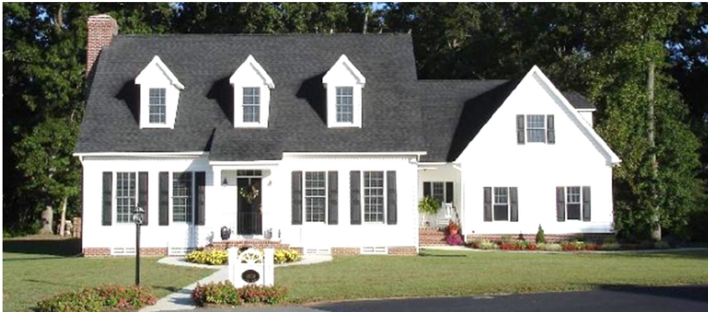
Größere Cape Cod mit 3 Schlafzimmern, Doppelgarage & Ausbaureserve